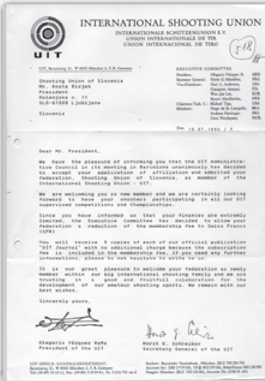
↑ Faksimile dokumenta o sprejemu SZS v UIT.

Pred sejo so v ŠZS in posameznih republiških panožnih zvezah potekali intenzivni razgovori o oblikovanju strategije za začasno sodelovanje športnikov v reprezentancah nekdanje Jugoslavije. V skladu s temi stališči sem oblikoval tudi strategijo nastopa na predsedstvu SSJ. Za po-