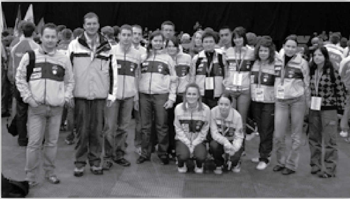
↑ Slovenska reprezentanca na EP v Pragi