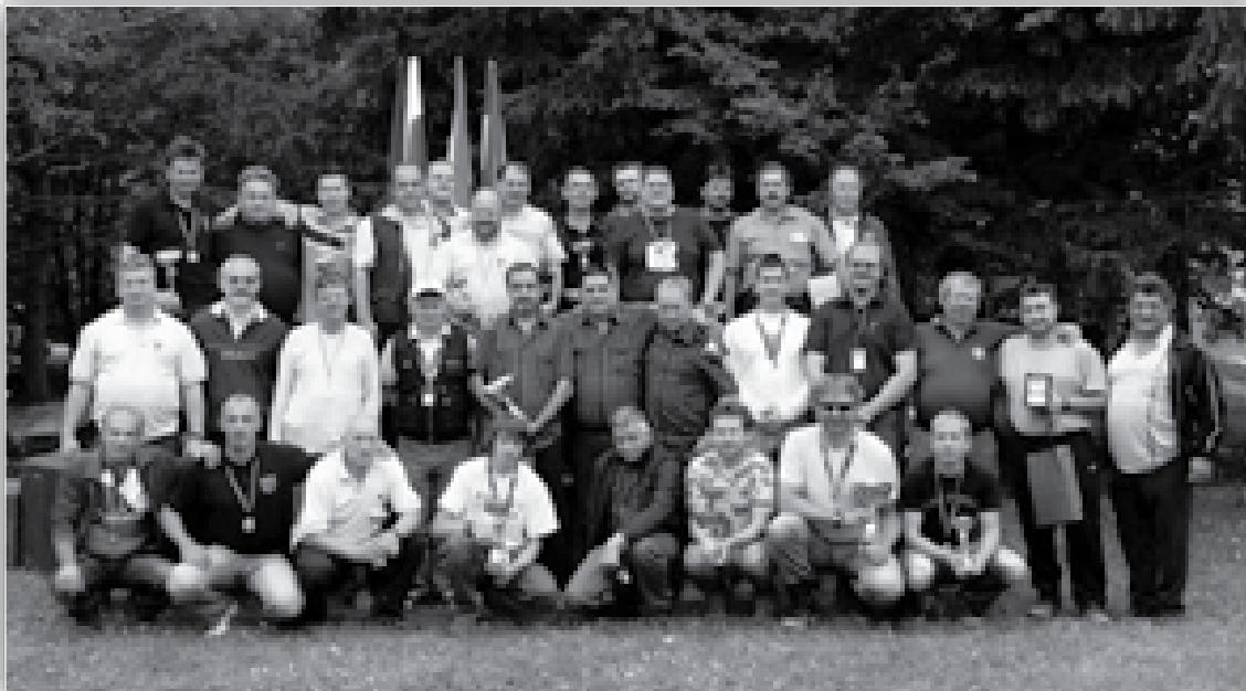
↑ V počastitev 25-letnice delovanja društva Jezero Dobrovnik je potekalo tekmovanje za Pokal občine Dobrovnik