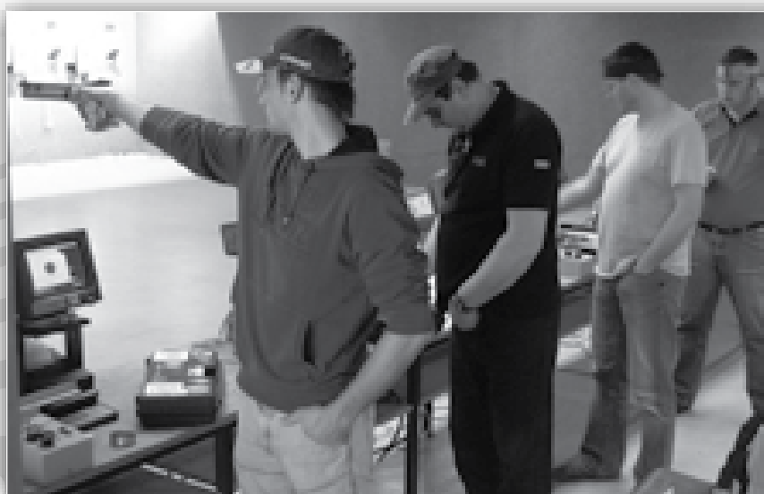
↑ Finalisti DP članov s pištolo se pripravljajo na 1. strel