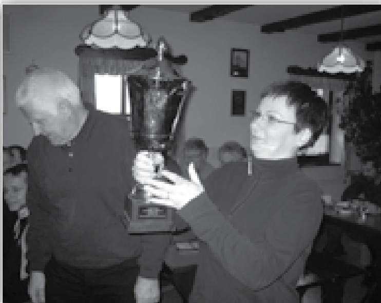
↑ Veliki prehodni pokal za tretjo zaporedno zmago so si strelci Podravja priborili v trajno last