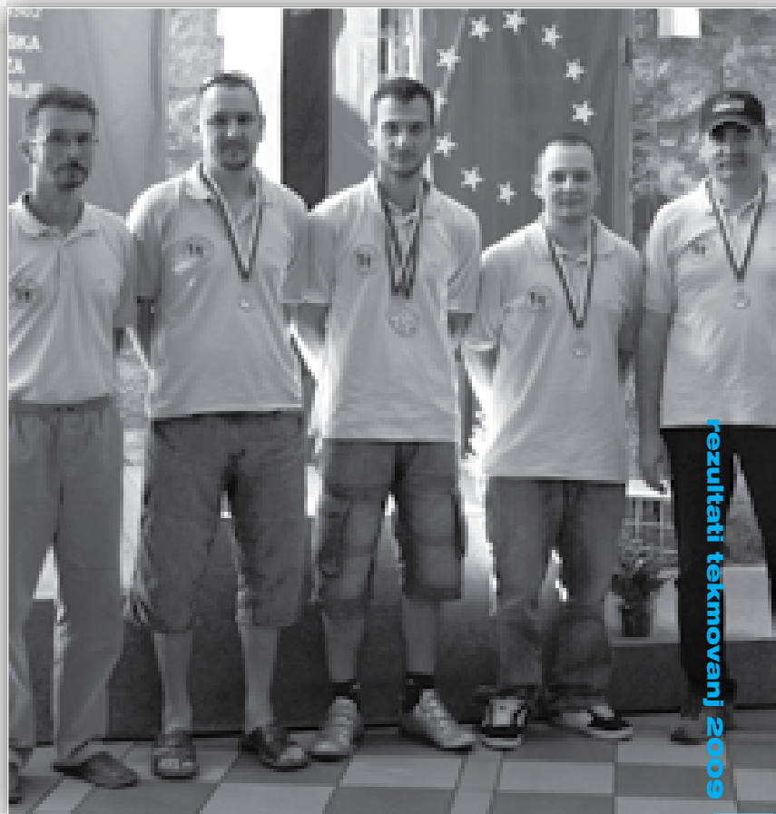
↑ Strelci iz Juršincev so znova postali najuspešnejše društvo DP z MK orožjem