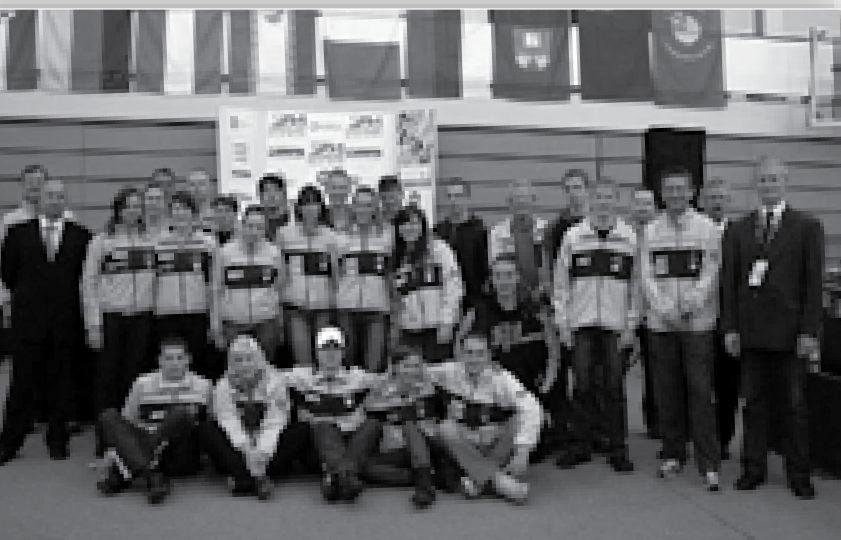
↑ Najštevilčnejša odprava slovenske reprezentance z zračnim orožjem se vsako sezono zbere na MT v Rušah.