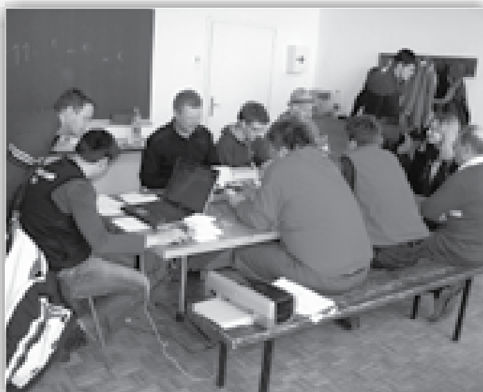
↑ Sodniški zbor na DP veteranov na Ptuj