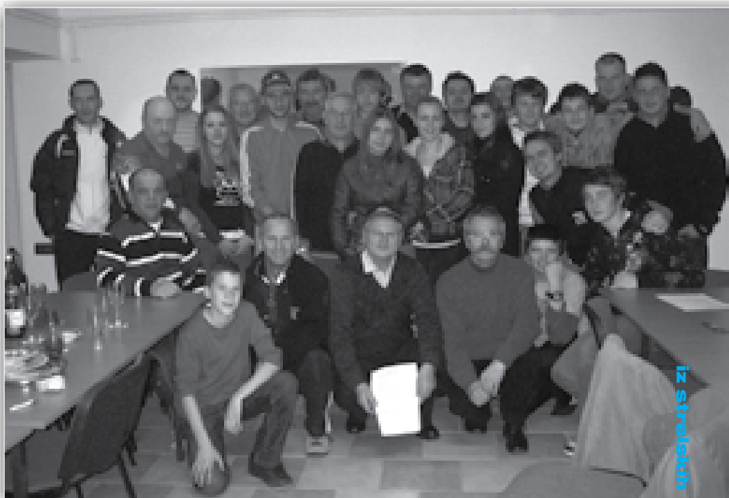
↑ Na znova obujenem 37. troboju v Varaždinu 18. 12. 2009