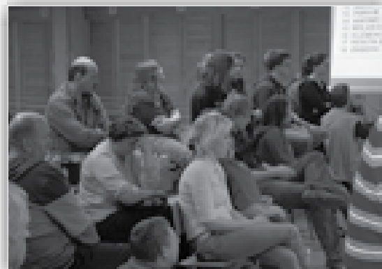
↑ Finalna streljanja je spremljalo veliko število gledalcev.