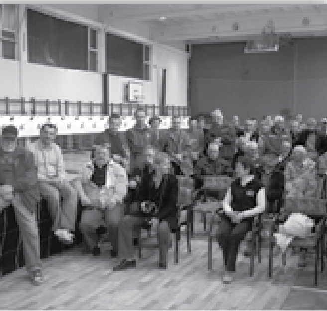
← Razglasitev rezultatov na DP veteranov Ptuj 2009.

V letu 2009 so po naši evidenci praznovali jubileje: