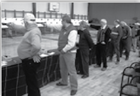
↑ Veterani s pištolo med streljanjem