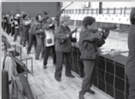
↑ Med streljanjem veterank na DP na Ptuju