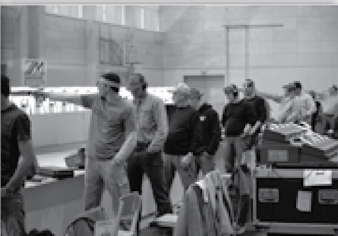
↑ Strelci z zračno pištolo na MT Maribor v Račah