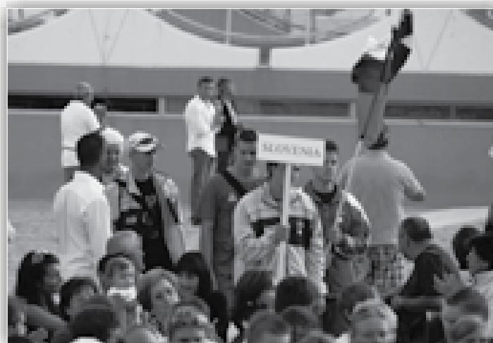
↑ Pred otvoritvijo mladinskega GP Porpetto